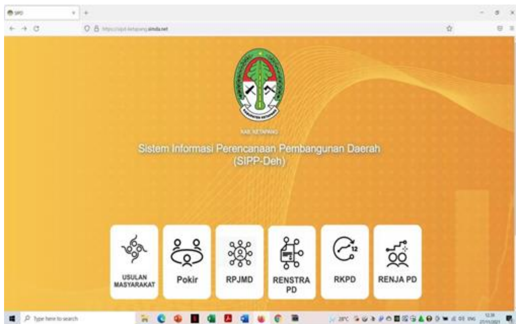
Gambar 2.1 Aplikasi Sistem Informasi Perencanaan Pembangunan Daerah Kabupaten Ketapang

Dalam proses penyusunan perencanaan tahun 2025 telah dilaksanakan Musyawarah Perencanaan Pembangunan (Musrenbang) secara berjenjang pada tahun 2023, yaitu melalui Rembug Warga, Musrenbang Kelurahan, Musrenbang Kecamatan dan Musrenbang Tingkat Kabupaten. Dari hasil pelaksanaan Musrenbang tersebut kemudian dapat dijarah berbagai aspirasi masyarakat ataupun para pemangku kepentingan. Umumnya aspirasi diarahkan pada Perangkat Daerah Teknis. Namun Dinas Ketahanan Pangan dan Perikanan Kabupaten Ketapang juga memiliki tanggung jawab dalam mengkoordinasikan pengakomodiran